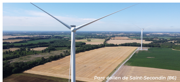
Parc éolien de Saint-Secondin (86)