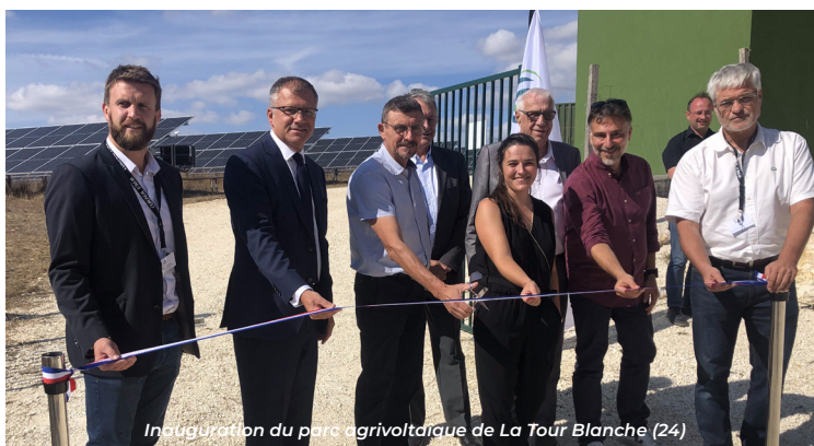
Inauguration du parc agrivoltaïque de La Tour Blanche (24)