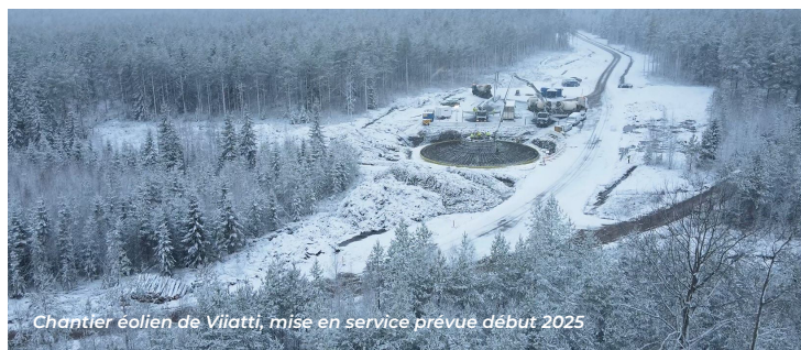
Chantier éolien de Viatti, mise en service prévue début 2025

VALOREM a concrétisé en Finlande l'un de ses plus gros projets éoliens , consolidant ainsi son positionnement à l'international. Ce parc produira 1,2% de la consommation annuelle d'électricité du pays !